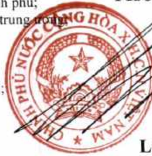
Lê Văn Thành

TM. CHÍNH PHỦ KT. THỦ TƯỚNG PHÓ THỦ TƯỚNG