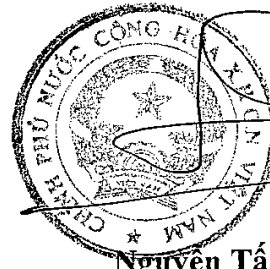
Nguyễn Tấn Dũng