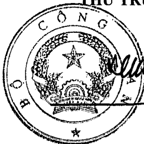
Thượng tướng Lê Quý Vương